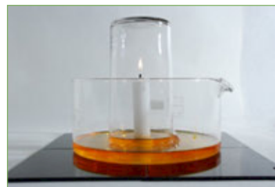
Figura 7. Pujada del nivell de l'aigua quan l'espelma comença a apagar-se.

Una experiència molt habitual per comprovar que una part de l'oxigen de l'aire es consumeix quan crema l'espelma consisteix a col·locar l'espelma en una cubeta amb aigua, encendre-la i tapar-la amb un vas cilíndric alt, amb la idea que, si la reacció consumeix oxigen, el nivell d'aigua en el vas pujarà, com passava amb l'experiència de l'oxidació del ferro (fig. 3). Si ho provem, observem que efectivament el nivell d'aigua puja (fig. 7), però ho fa fonamentalment quan l'espelma s'apaga, i no progressivament mentre l'espelma crema. Per tant, d'aquesta experiència no en podem concloure que l'oxigen