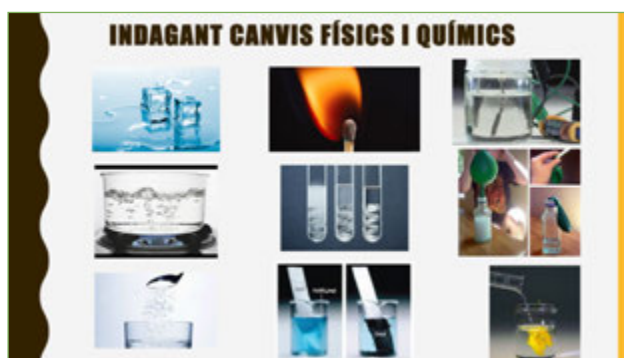
Figura 1. Alguns dels canvis físics i químics que s'investiguen en la seqüència.

La indagació i interpretació dels canvis físics i químics de la seqüència permet classificar-los com a canvis físics (A1, A2, A4, A13, A15) o com a canvis químics (la resta). Aquests últims es poden interpretar com a reaccions de formació (A5, A6, A7, A8, A9), reaccions de descomposició tèrmica (A10, A11), reaccions de descomposició electrolítica (A14), reaccions de descomposició