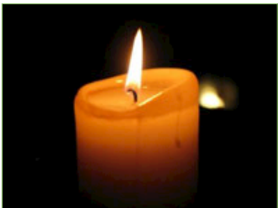
Figura 6. Espelma cremant.

4. Descripció de les observacions. Observem que alguns filaments de la superfície del fregall es posen incandescents i quan es refreden presenten una coloració marronosa i alguns es trenquen i cauen al fons del recipient.