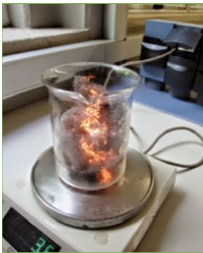
Figura 5. Una altra manera de cremar la llana d'acer i de comprovar que pesa més després de cremar-se.