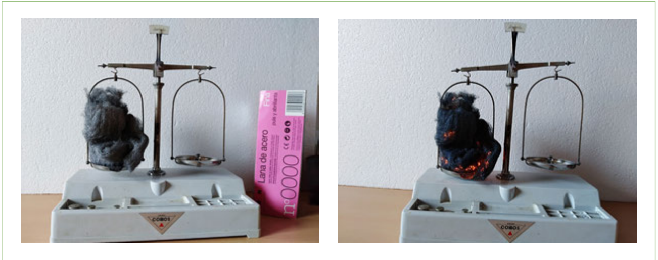
Figura 4. El fregall de llana d'acer pesa més després de cremar-lo.