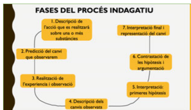
Figura 2. Fases del procés seguit en la indagació i modelització dels canvis físics i químics.